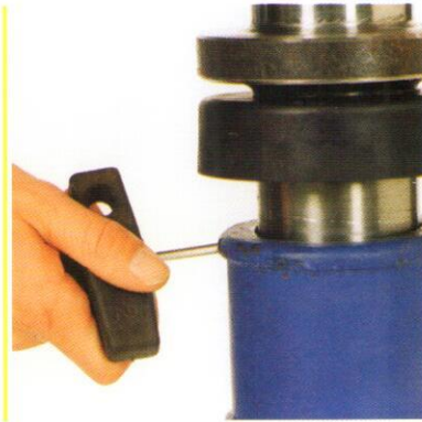
... und Herausdrehen des Sicherungsstiftes...