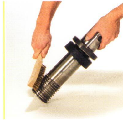
... kann das Gewindeteil herausgedreht werden.

Wenn das Gewindeteil einmal pro Jahr gereinigt und gefettet wird, bleibt die Spindel auch nach jahrelangem Gebrauch noch drehfreudig.