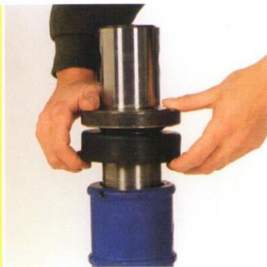
Durch einfaches Abziehen des Dichtungsringes...

Die Spindel des SBH Systems besteht aus einem Gusskörper und Gewindeteilen, die zur höheren Druckkraftaufnahme aus Vollmaterial hergestellt sind. Die Flanschringe zentrieren die Verbindung zwischen Spindel und Zwischenrohr.